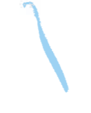
Objets en plastique non emballage