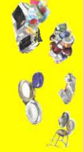
Capsules, sachets, boîtes, tubes, opercules...