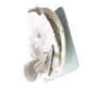
Vaisselle en verre, porcelaine