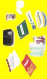
Pots, boîtes, barquettes, sachets, films, tubes...