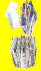
Tous les papiers